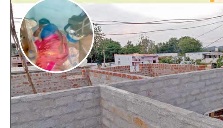
అర్ధాంతరంగా నిలిపివేసిన ఇందిరమ్మ ఇళ్ల పనులు. (ఇన్సెటి)పొరగిడిన కూలిపోవడంతో బాటూమలోనే నిర్మిస్తున్న వృద్ధురాలు

అర్ధిదారులు కొందరు అరుబయిటే వగలు రాల్చి జీవనం సాగిస్తున్నారు. గతవారం కింద కురిసిన వర్షాలకు వారు ఎదుర్కొన్న కష్టాలు వర్షనాశితం. ఈ వరిస్థితి ఎక్కడోకాదు. వికారాబాద్ జిల్లా పూడూరు మండలానికి చెందిన ఎన్యెవల్లి వందాయతీపాటు, దాని అనుబంధ గ్రామం చెంచుపల్లిలోనే. ఈ గ్రామం 2024-25 సంవత్సరంలో ఆదర్శ గ్రామంగా ఎంపికైంది. ఎన్యెవల్లి, చెంచుపల్లి గ్రామాల్లో అధికారులు అప్పట్లో సర్వేచేసి 241మంది ఇళ్ల లేని పేదలను గుర్తించారు. వారికి ఇందిరమ్మ ఇళ్ల పథకం కింద అర్ధిదారులుగా ఎంపికచేసి ప్రోసీడింగులు అందజేశారు. సుమారు 45 రోజుల్లో అర్ధిదారులు సొంతంగా ఉంటే నిర్మాణం చేపడితే, బేస్మెంట్, రూఫ్ లెవెల్, స్లాబ్, ఇళ్ల నిర్మాణం పూర్తి అయిన తరువాత 4 విడతలుగా టిల్లులు చెల్లించాలన్నది ప్రభుత్వ నిబంధన. అయితే చెంచుపల్లి గ్రామంలో పూర్తిగా ఆర్థికంగా వెనుకబడిన (చెంచు) కులాలికి చెందిన ఎన్.బి.ఎ. డబ్బులు పెట్టబడి పెట్టి ఇళ్ల నిర్మాణం చేపట్టే స్థితి వారికి లేదు. దీంతో వారి ఇళ్లను నిర్మించేందుకు నాటి స్థానిక ప్రజా ప్రతినిధులు ఓ ప్రైవేటు కాంట్రాక్టర్ కు పనులు అప్పగించారు. ప్రభుత్వ నిర్ణయ గడువులోపల ఇందిరమ్మ ఇండ్లను నిర్మించి అర్ధిదారులకు ఇవ్వాలన్నది కాంట్రాక్టర్ల అప్పట్లో కుదుర్చుకున్న ఒప్పందం. అయితే సదరు కాంట్రాక్టర్ సకాలంలో ఇళ్లను నిర్మించక పోవడంతో బేస్మెంట్ లేవడంతో కొన్ని