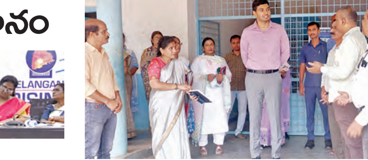
తూంకుంట పైసూర్లో నిర్మించిన తూంకుంట కలెక్టర్